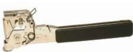
Herramienta HT-550 Peso: 0.900 Kgs De Golpe / ( Grapa JC )