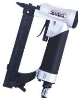
S-71 DEACERO Peso: 0.900 Kgs Neumática / ( Grapa C )