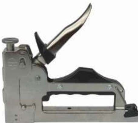
Herramienta CS-5000 Peso: 0.820 Kgs Mecánicas de Palanca / ( Grapa JC )