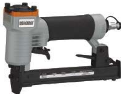
S-95 DEACERO Peso: 0.900 Kgs Neumática / ( Grapa JC )