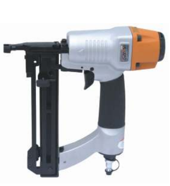
Herramienta S-19 DEACERO Peso: 1.200 Kgs, Neumática